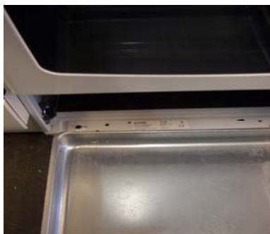
unter der Geschirrlade im Sockelrahmen