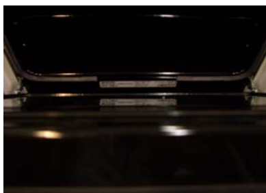
Bei Elektroherde finden Sie das Typenschild entweder bei geöffneter Türe im Backofenrahmen oder