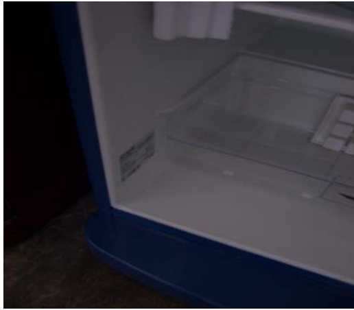
Kühlgeräte unteren Bereich der linken Seitenwand innen