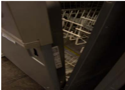
Geschirrspüler im Türrahmen rechts